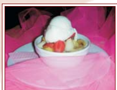
MACEDONIA CON GELATO