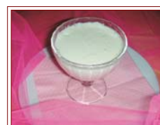
PANNA COTTA ai Frutti di Bosco - al Caramello - al Cioccolato