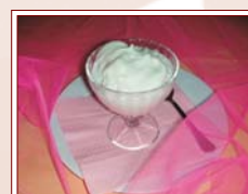
SORBETTO AL LIMONE