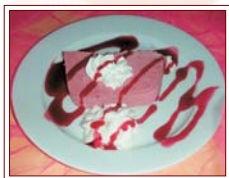
MOUSSE AI FRUTTI DI BOSCO